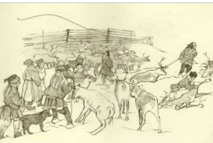
Merja-Aletta Ranttila/ Saamelaimuseo Siidan taidekokoelma