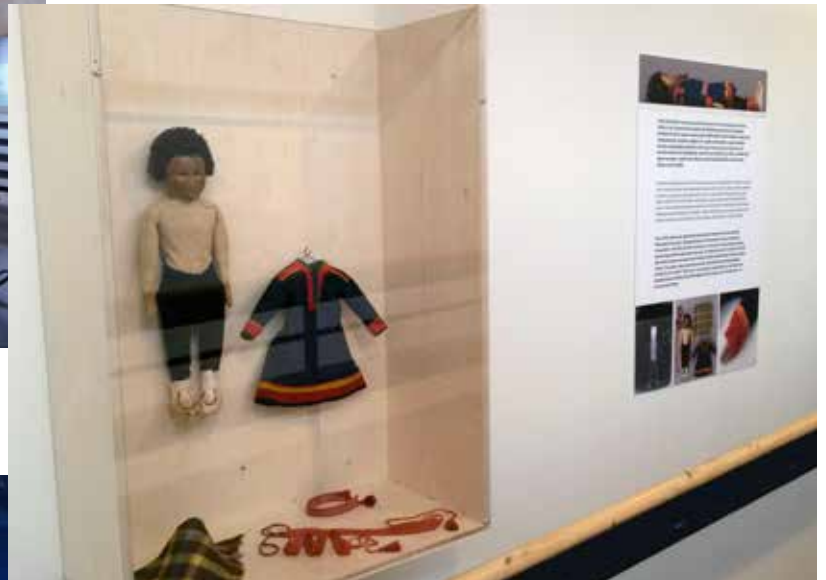
Aili ja nuket -näyttely Siidassa.