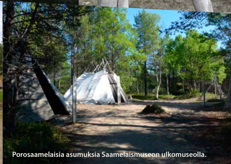
Porosaamelaisia asumuksia Saamelaismuseon ulkomuseolla.

Hirsirakennusten lisäksi museoalueella on siirrettäviä kota- ja laavurakenteita ja turverakennuksia, sekä erilaisia säilytys- ja pyydysrakenteita. Oman kokonaisuuden muodostaa museoalueen läpäisevän puron varrella sijaitseva kultakämpä. Myös Saamelaismuseon veneet, ahkiot ja reet ovat säilytyksessä ja nähtävillä ulkomuseon näyttelyhallissa. Seitsemän hehtaarin ulkomuseoalueella on merkittäviä kohteita yhteensä 43 kappaletta, joista alkuperäisiä on 16 ja rekonstruktioita 27. Saamelaismuseon ulkomuseoalueen rakennukset ja esineet ovat osa Saamelaismuseon kokoelmia.