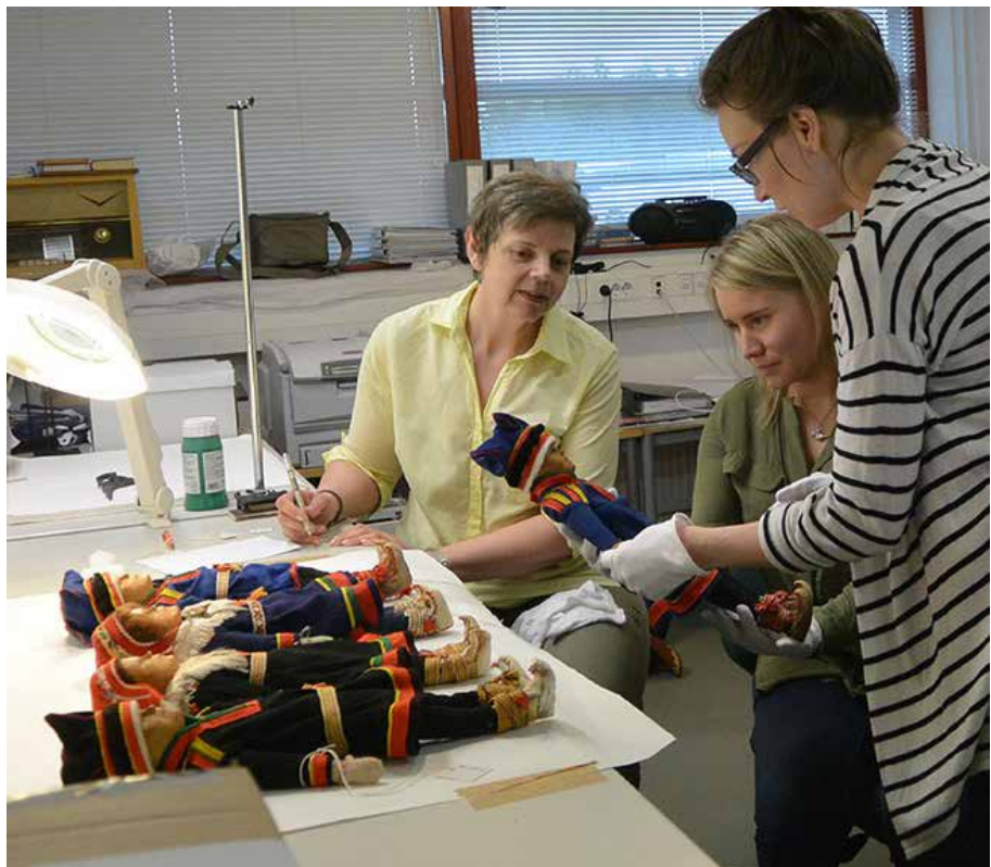
Aili ja nuket -näyttelyyn liittyvää esinetutkimusta.

Esine- ja valokuvatietoja siirretään jatkuvasti digitaaliseen muotoon oman henkilökunnan ja korkeakouluharjoittelijoiden voimin. Jälkimmäisessä tapauksessa henkilökunta ohjeistaa ja perehdyttää työntekijät.