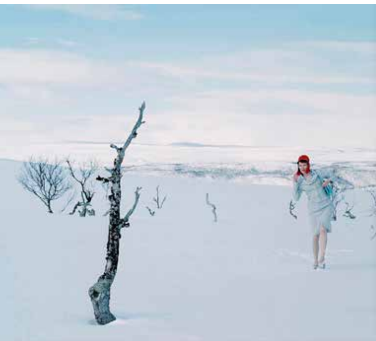
Marja Helander/Saamelaimuseo Siidan taidekokoelma