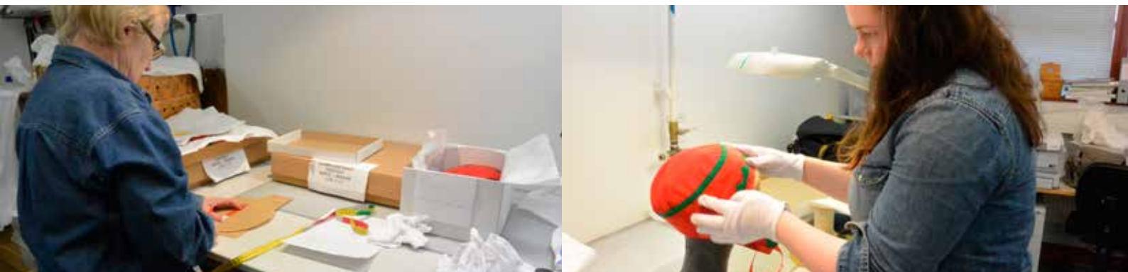
Käsityöläiset, opiskelijat ja tutkijat käyvät tutkimassa Saamelaismuseon kokoelmia.

Saamelaismuseon kokoelmilla on erilaisia käyttötärpeita, -tapoja ja käyttäjäryhmiä, joille museon kokoelmapalveluja suunnataan. Kokoelmapalvelujen kehittäminen ja oikealle käyttäjäryhmälle suuntaaminen edellyttää kokoelmien käyttäjä- ja asiakasryhmien tuntemusta. Kokoelmien käyttäjäryhmiä ja heidän erityistarpeitaan kartoitetaan erilaisten asiakaskyselyjen ja asiakaspalvelukokemusten kautta.