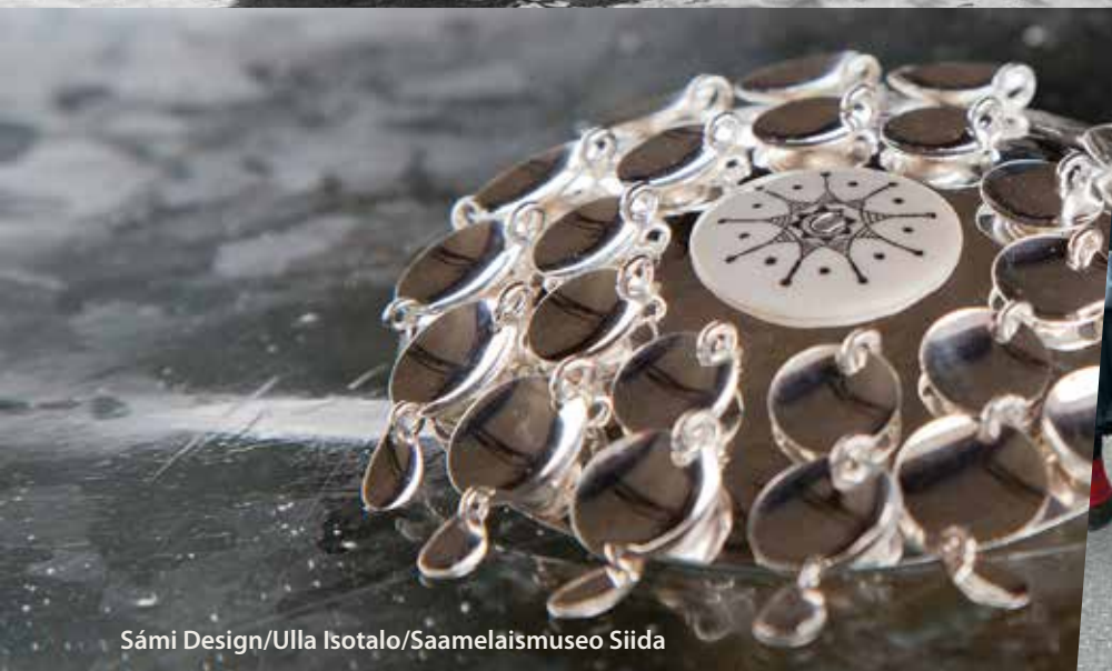
Sámi Design/Ulla Isotalo/Saamelaismuseo Siida