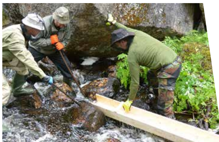
Ulkomuseon kullanhuhdonta-alueen ränniä uusitaan.