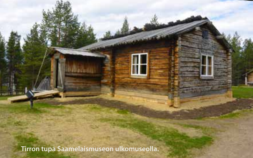
Tirron tupa Saamelaismuseon ulkomuseolla.