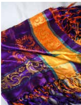
Silkki Saamelaismuseon kokoelmissa.

Saamelaismuseon kansallisena tallennusvastuualueena on saamelaisten aineellinen ja aineeton kulttuuriperintö ensisijaisesti saamelaisten kotiseutualueella Suomessa. Saamelaisalueeseen kuuluu Enontekiön, Inarin ja Utsjoen kunnat sekä Sodankylän kunnassa Lapin paliskunnan alue. Alue kattaa kaikki saamelaiset kieli- ja kulttuuriryhmät. Saamelaismuseon tallennusvastuuseen kuuluu saamelaiskulttuuri myös muualla Suomessa, esimerkiksi Helsingissä. Alkuperäiskansamuseona Saamelaismuseo tallentaa myös tapauskohtaisesti saamelaisiin ja muihin alkupe- räiskansoihin liittyvää kulttuuriperintöä Suomen rajojen ulkopuolelta.