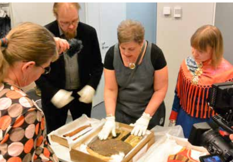
Tiedotustilaisuus Museokeskus Vapriikissa 2015