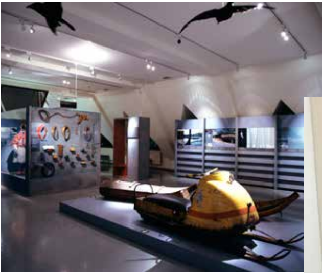
Saamelaismuseon tuottama Siiddastallan-näyttely Kansallismuseossa 2004.

Saamelaismuseon näyttelyiden keskeisenä tavoitteena on kertoa saamelaisesta kulttuurista museo-objektien ja niihin liittyvän tiedon kautta. Saamelaismuseon kokoelmia esitellään museon perusnäyttelyssä, vaihtuvissa näyttelyissä, kiertonäyttelyissä ja aluetoimipisteissä. Näyttelyissä esitellään ensisijaisesti aitoja objekteja, mutta esille voidaan laittaa myös kopioita tai opetuskokoelmaan kuuluvia objekteja, joista on erillinen maininta näyttelyteksteissä. Lisäksi näyttelyissä käytetään kokoelmiin liittyvää tietoa, merkityksiä ja tarinoita. Erilaiset alkuperäisaineistot ja -materiaalit määrittävät sen, millaiset näyttelyolosuhteet objekti tarvitsee. Saamelaismuseon museo-objektien näyttelykäyttöä ja -olosuhteita linjaa museon näyttelypolitiikka sekä kokoelmapoliittisen ohjelman ohjeistus objektien käsitteeseen.