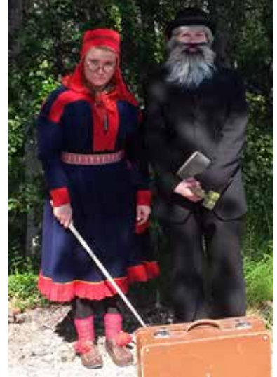
Museopedagogiikkaa Saamelaismuseon ulkomuseopäivässä 2016.