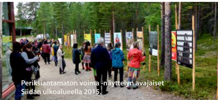
Periksiantamaton voima -näyttelyn avajaiset Siidan ulkoalueella 2015.