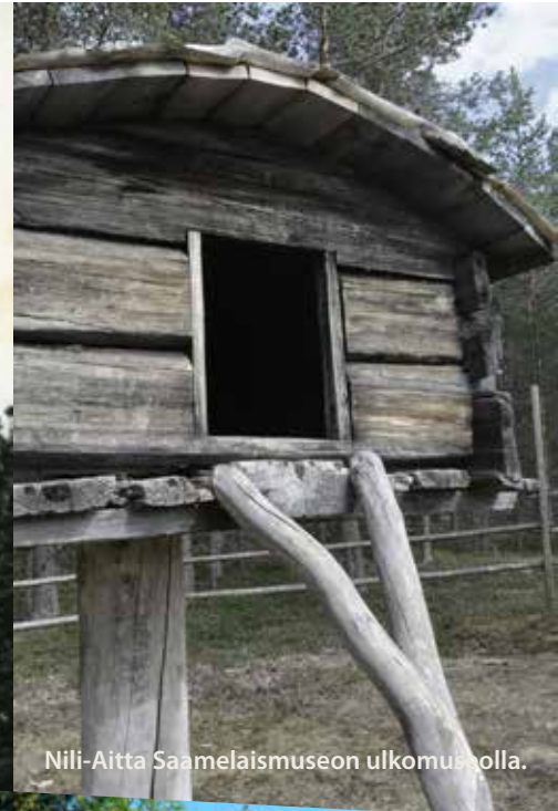
Nili-Aitta Saamelaismuseon ulkomuseolla.