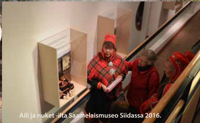
Aili ja nuket -ilta Saamelaismuseo Siidassa 2016.