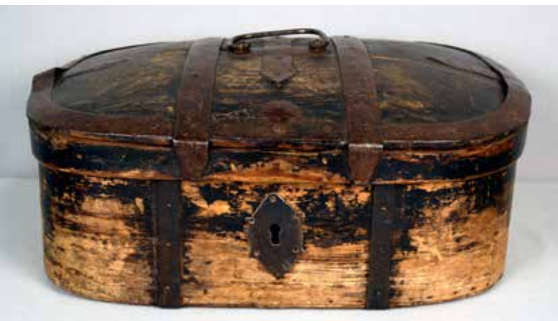
Kiisa Saamelaimuseon kokoelmissa