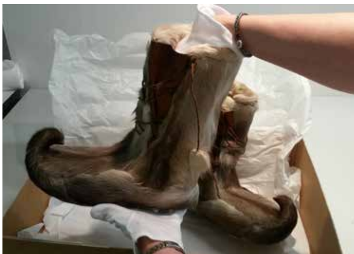
Saamelaismuseon kokoelmiin tallennetut nutukkaat.