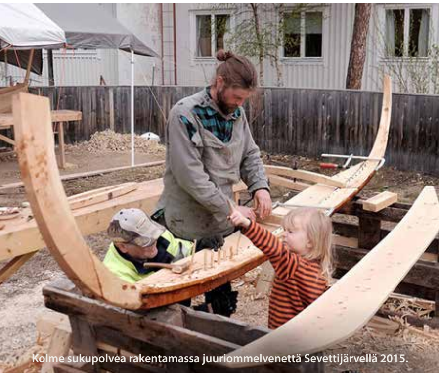
Kolme sukupolveä rakentamassa juuriommelenettä Sevettijärvellä 2015.

Saamelaismuseon kokoelmatyön keskeisin arvo on yhteisöllisyys. Kokoelmatyössä mahdollistetaan yhteisön osallistuminen museotyöhön, sen suunnitteluun ja kehittämiseen. Saamelaismuseon kokoelmat, museo-objektit ovat käyttäjiä varten. Tätä varten Saamelaismuseo huomioi kokoelmatyössään erityisesti yhteisön ja käyttäjien tarpeet ja toiveet sekä ymmärtää vastuunsa siitä, että museo hallinnoi koko Suomen saamelaisen yhteisön ja Euroopan unionin ainoan alkuperäiskansan yhteistä kulttuuriperintöä.