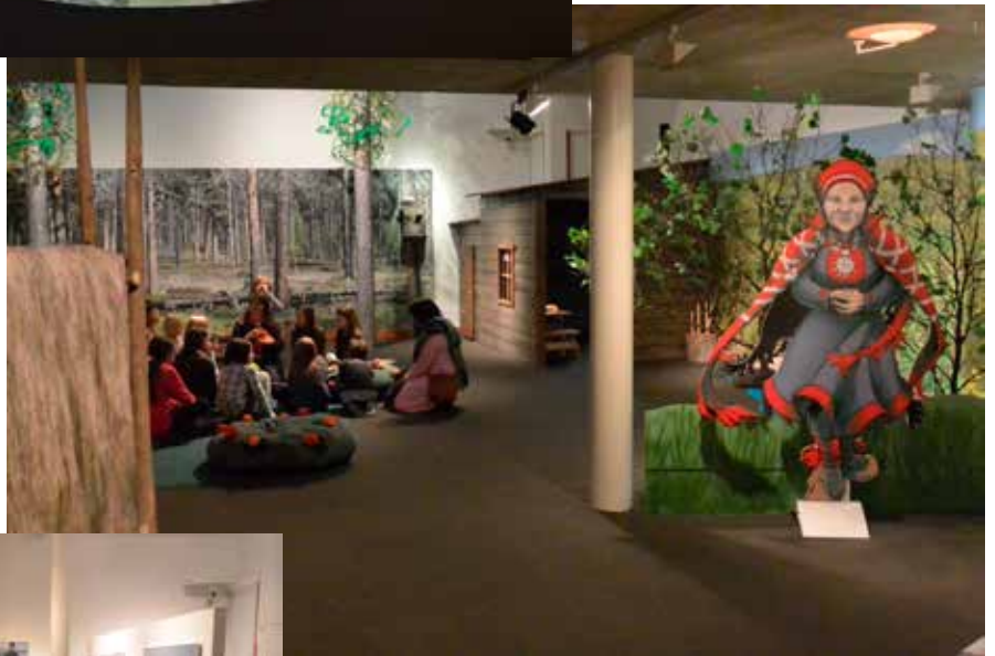
Gieddegeažis - Kentänpäässä -lastennäyttely Siidassa.