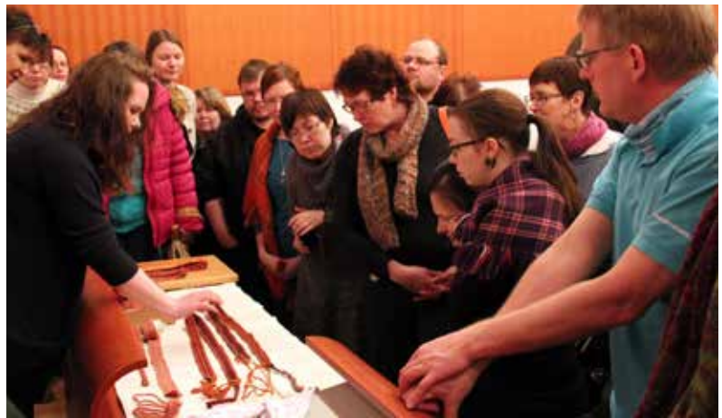
Paulatutkimuksen esittelyä Siidassa 2015.

Esinetutkimus sisältää yksinkertaisimmillaan kokoelman esineiden ja valokuvien tietojen ylläpitoa ja täydentämistä (esim. pukujen ja asusteiden perinnealueiden määrittely, esineiden ajoittaminen ja kunnan ja laadun määrittely). Lisäksi se voi olla esim. kokoelman esineryhmien tarkempaa tutkimista, vanhoihin malleihin ja tekniikoiden liittyvän tietopankin kokoamista (sekä tekstiilien että koviin esineiden osalta esim. neulemallit, paula- ja vyömallit, materiaalit eri aikoina, materiaalien käsittely eri aikoina) tai esineiden ja valokuvien kontekstietojen selvittelyä.