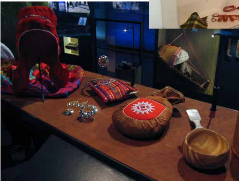
Saamelaismuseon kokoelmaesineitä Siidan perusnäyttelyssä.