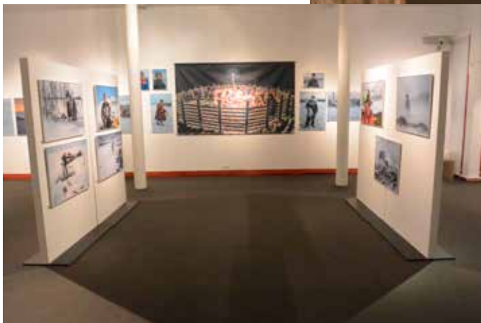
Siidan vaihtuvien näyttelyiden tilassa Raittijärvi – Kaijukan kylä -näyttely.