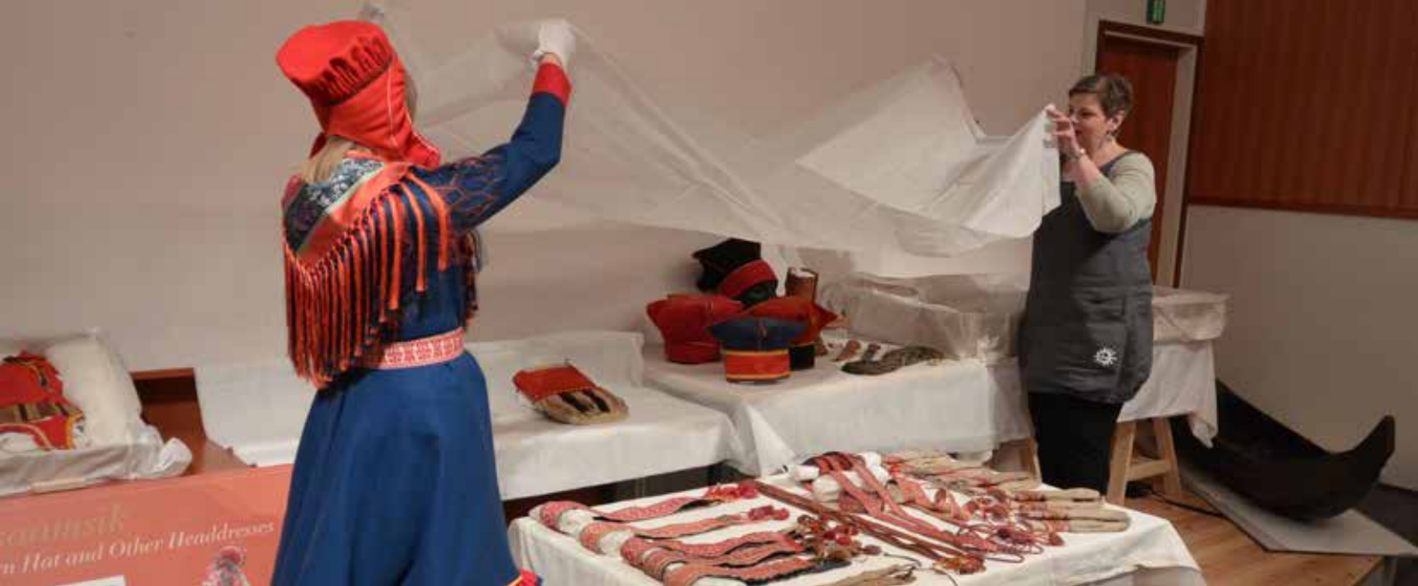
Museokeskus Vapriikin kokoelmasiirron esittely Siidassa 2015.