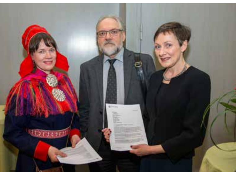
Kansallismuseon ja Saamelaismuseum Siidan aiesopimus allekirjoitettiin 2017.

Saamelaismuseum Siida osallistuu Kansallismuseon alaisena toimivan Tallennus- ja kokoelmayhteistyöryhmän (TAKO-ryhmän) toimintaan. TAKO on museoiden tallennus- ja kokoelmayhteistyötä koordinoiva ammattilisten museoiden yhteenliittymä, joka ohjaa ja koordinoi kulttuurihistoriallisten museoiden yhteistyötä.