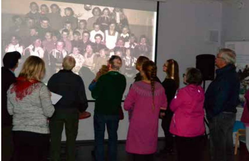
Saamelaismuseon kuvakokoelman kuvia tarkastellaan kuvaillassa Utsjoella.

Saamelaismuseon kokoelmiin liittyvää tietoa hyödynnetään museopedagogias- sa, kuten työpajoissa ja tapahtumissa. Jos museopedagogisessa toiminnassa on olennaista käsitellä konkreettisia objekteja, käytetään opetuskokoelman esineitä, kirjastokokoelman duplikaatteja ja valokuva- ja asiakirja-aineiston kopioita.