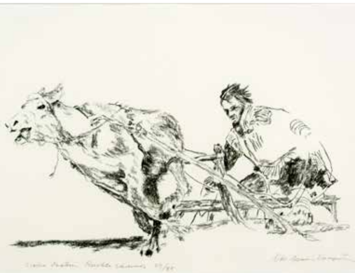
Nils-Aslak Valkeapää/Johtti Sápmelaččat ry:n taidekokoelma