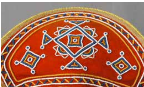
Hopeanappeja Saamelaismuseon kokoelmissa. Kolttasaamelainen vaimonpäähine Saamelaismuseon kokoelmissa.