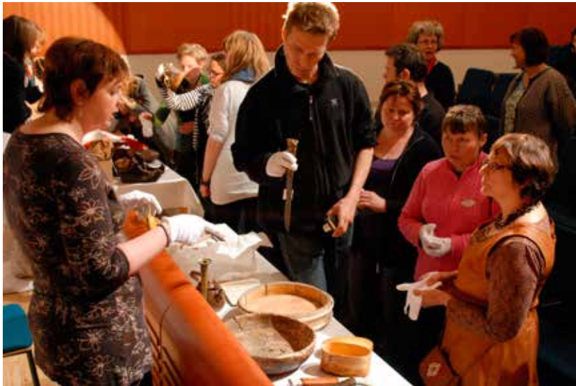
Saamelaismuseon kokoelmaesineitä esillä esinehuoltoillassa Siidassa