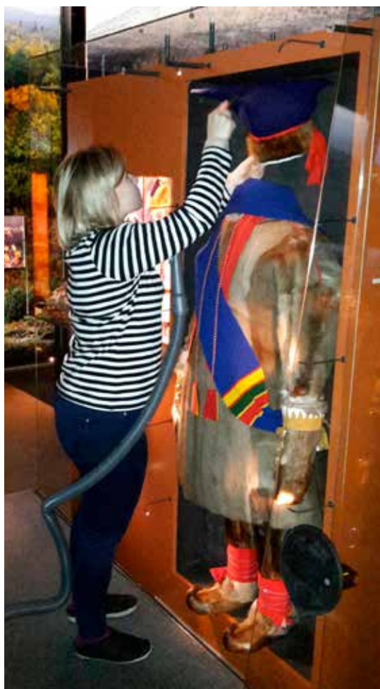
Siidan perusnäyttelyn esineiden puhdistusta.