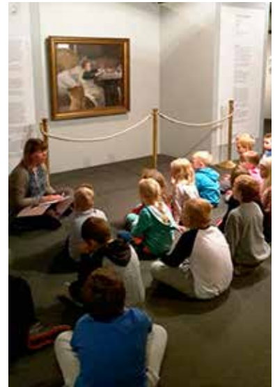
Museopedagogiikkaa Toipilas- teoksen äärellä Siidassa 2017.