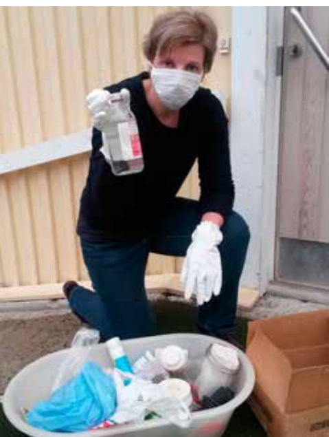
Utsjoen vanhan terveystalon esineistön inventointia näyttelyä varten.

Ennalta tuntemattomiin tutkimus- ja inventointikohteisiin lähtee turvallisuus- ja terveysnäkökulmista vähintään kaksi henkilökuntaan kuuluvaa työntekijää. Museon ulkopuolisten kohteiden aineiston seulonnassa voi altistua pöly-, home- ja tuhoeläinvaaralle ja joutua kosketuksiin rikkoutuneiden lasien, ruosteisten metallien, epäkuntoisten kojeiden, myrkkujen ja muiden vaarallisten aineiden tai aseiden kanssa. Tämän kaltaisissa tehtävissä on tärkeää suojautua hyvin suojakäsinein ja hengityssuojaimin, noudattaa erityistä varovaisuutta ja pyrkiä työskentelemään hyvässä valaistuksessa. Ongelmatilanteista raportoidaan turvallisuushavainto/vaaratilanneilmoituslomakkeella viipymättä esimiehelle