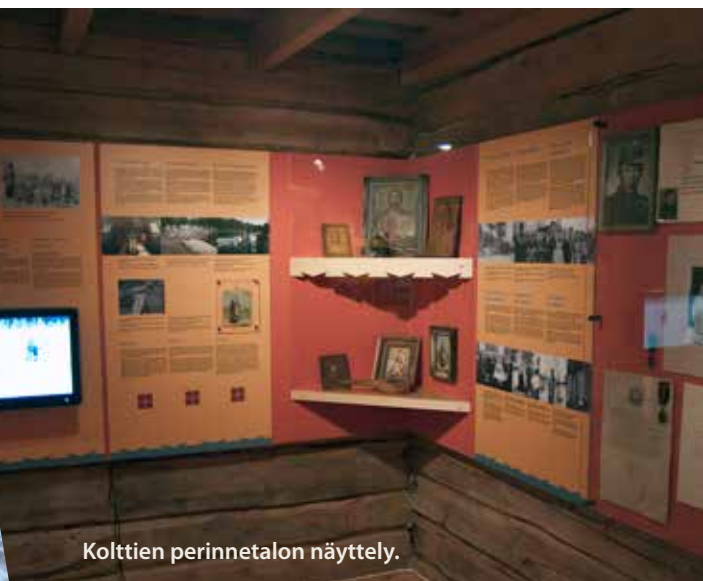
Kolttien perinnetalon näyttely.