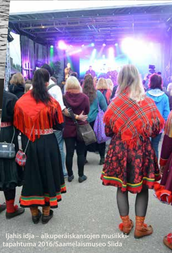
Ijahis idja – alkuperäiskansojen musiikki-tapahtuma 2016