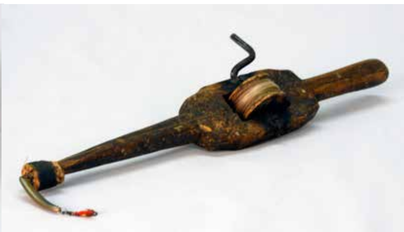
Pilkki Saamelaimuseon kokoelmissa