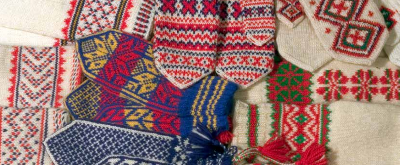
Suomen saamelaisalueen lapasmalleja