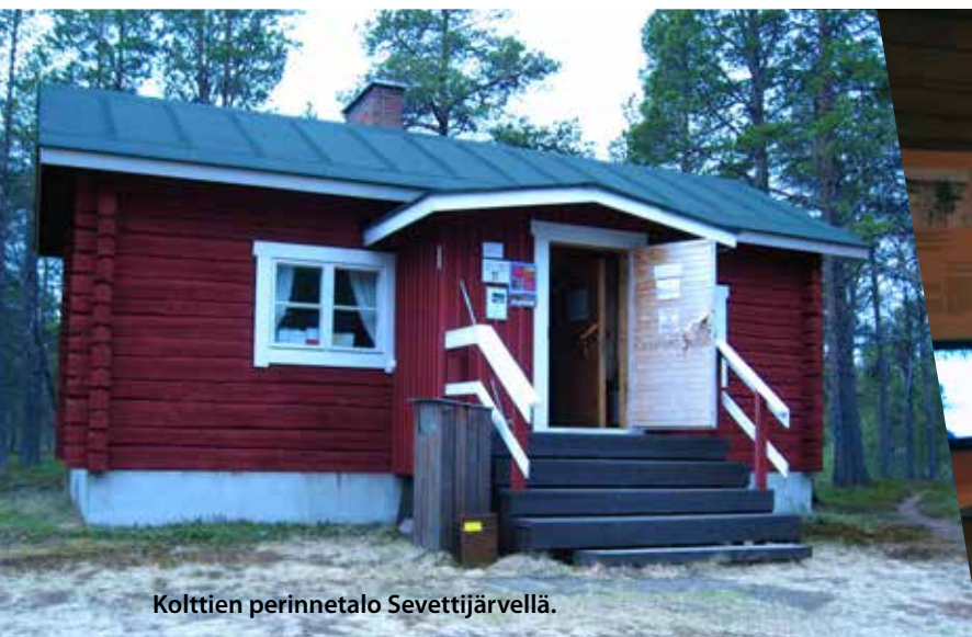
Kolttien perinnetalo Sevettijärvellä.

Perinnetalo toimii kolttatilan päärakennuksessa, joka edustaa sodanjälkeisen asutusajan tyyppitaloa 1940-luvun lopulta. Valtio teetti kyseisen talon ja varaston Kirakkajärvelle, mutta tila jäi kuitenkin asuttamatta. Tyhjiillään olleet rakennukset siirrettiin nykyiselle paikalleen 1990-luvun alussa esittelemään kolttakulttuuria. Perinnetalon pihapiiriin tehtiin vuonna 2007 ulkomuseoalue, joka on Suonjelin/Suonikylän aikaisen kesäpaikan rekonstruktio tupineen ja aittoineen. Myöhemmin pihapiiriin siirrettiin savusauna, lammaspuura ja kalakellari. Koska Suenjelin aikaiset rakennukset suurelta osin joko tuhoutuivat sodassa tai sen jälkeisissä vaiheissa, rakennukset on tehty pääosin kirjallisten kuvausten, säilyneen kuvamateriaalin ja muistelusten perusteella.