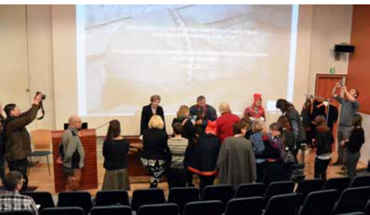
Hämeenlinnan kaupunginmuseon saamelaiskokoelman esittely Siidassa 2016.